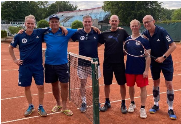
Senioren-Team als frischgebackene Meister der Verbandsliga, 13.07. beim LTTC Rot-Weiß

https://www.wode.de/das-wunder-von-berlin/