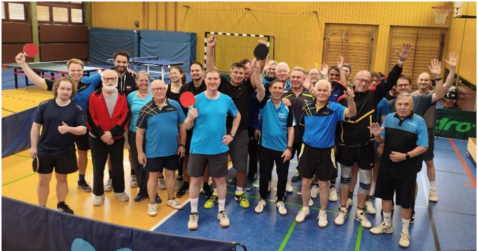
Alle Teilnehmer der VEM 2025