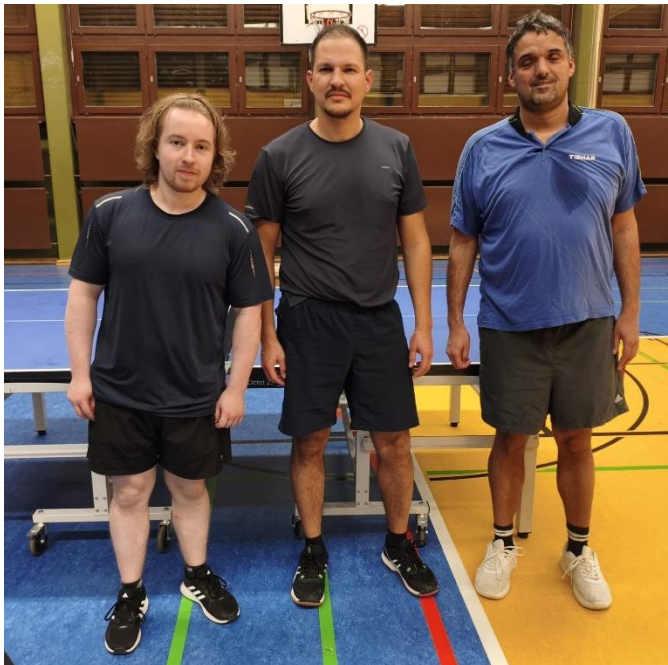
Starke Finalisten der VEM 2025