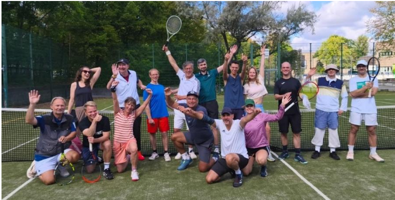
PSV-Tennis zusammen mit BAK

Am 06.09.25 veranstaltete der PSV-Tennis zusammen mit dem Bezirksamt Kreuzberg Tennis (BAK) ein gemeinsames Doppel/Mixed-Turnier - bei perfektem Spätsommerwetter. Es nahmen insgesamt 16 Spieler aus beiden Vereinen teil. Die einzelnen Paarungen waren sehr ausgeglichen und nach umkämpften Spielen waren die Sieger: